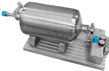
5 Liter Druckluftspeicher

Pneumatischer Druckverstärker, der zur gezielten Betriebsdruck-Erhö- hung eingesetzt wird. Der gewünschte Ausgangsdruck kann am Druckregler manuell eingestellt werden. Der Druckbooster gleicht Druckschwankungen zwischen dem Eingangs- und Ausgangsdruck aus.