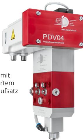
PDV04 mit montiertem Sprühaufsatz